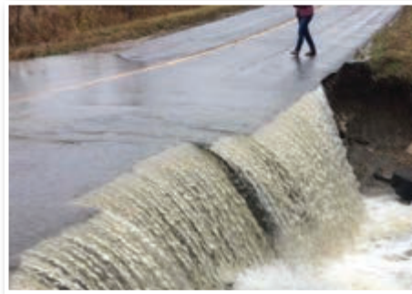
Chemin des Érables, printemps 2017.

Les travaux de base menés en 2018 viseront à favoriser l'intégrité des chemins en ce qui a trait à l'évacuation des eaux de surface et pourront comprendre, par exemple, le remplacement ou le redimensionnement des ponceaux, la correction des pentes d'écoulement des chemins,